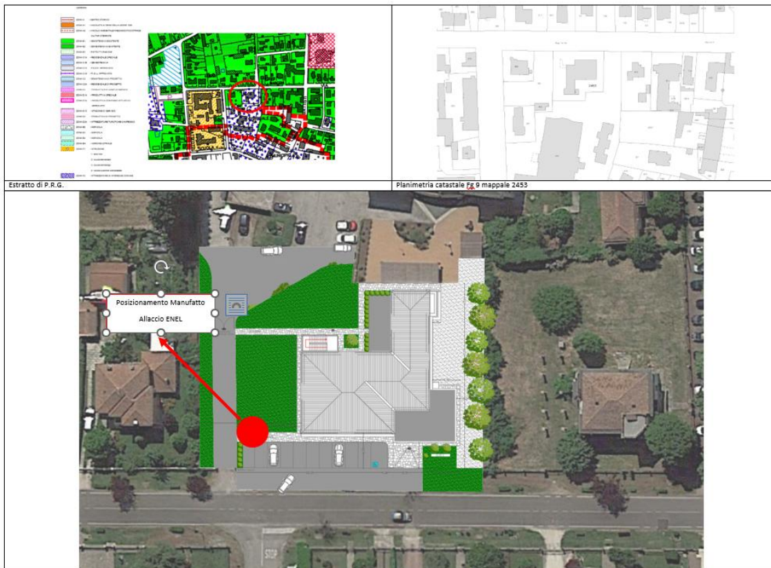
Figura 2-Planimetria catastale e PRG